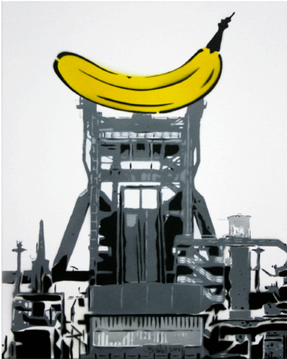
Phoenix Banane Spraylack auf Leinwand, 50 cm x 40 cm